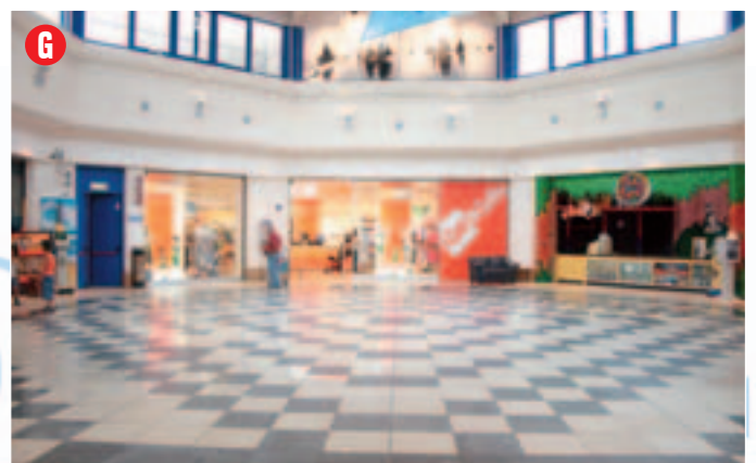
Situato nella Piazza Ovest, misure: 5 x 4 m. circa, punto luce: disponibile, altezza: non oltre 1,60 m.