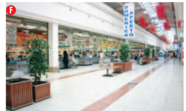
Situato lungo il corridoio tra le fioriere, misure: 1,5 x 2 m. circa, punto luce: non disponibile, altezza: non oltre 1,60 m.