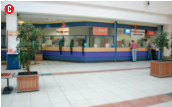
Situato lungo il corridoio tra le fioriere, misure: 1,5 x 2 m. circa, punto luce: non disponibile, altezza: non oltre 1,60 m.