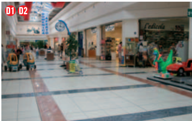
Situato lungo il corridoio tra le fioriere, misure: 1,5 x 2 m. circa, punto luce: non disponibile, altezza: non oltre 1,60 m.

N.B. Al centro della galleria, nello spazio centrale, tra l'Ipercoop e il ristorante, è presente un ampio spazio di circa 4 mq. Questo spazio è a disposizione del centro commerciale soprattutto per autopromozioni. Il suo utilizzo è a discrezione del direttore del centro.