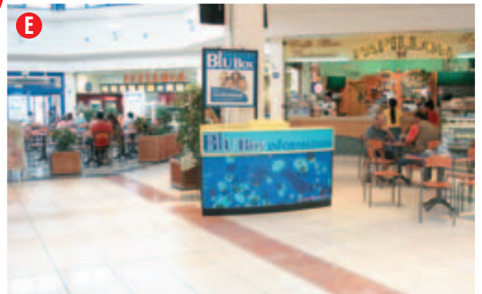
Desk fisso (con sedia, banco e mobile contenitore), personalizzabile sul fronte del bancone e con lo spazio per un poster. Situato al centro della galleria vicino al ristorante, punto luce: disponibile ma con capacità limitata (adatto ad alimentare un computer)

N.B. Al centro della galleria, nello spazio centrale, tra l'Ipercoop e il ristorante, è presente un ampio spazio di circa 4 mq. Questo spazio è a disposizione del centro commerciale soprattutto per autopromozioni. Il suo utilizzo è a discrezione del direttore del centro.