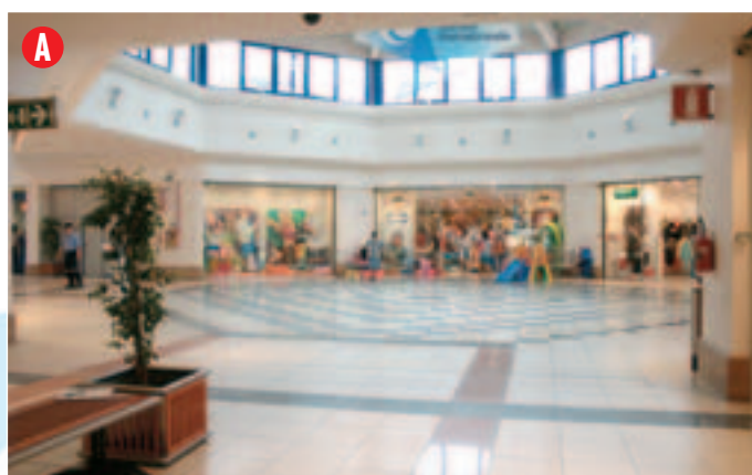
Situato nella Piazza Est, misure: 5 x 4 m. circa, punto luce: disponibile, altezza: non oltre 1,60 m.